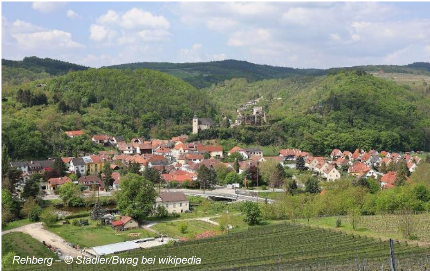
Rehberg